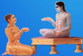
గురు శుక మహర్షి