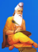
గురు వేదవ్యాస మహర్షి