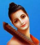
గురు నారద మహర్షి